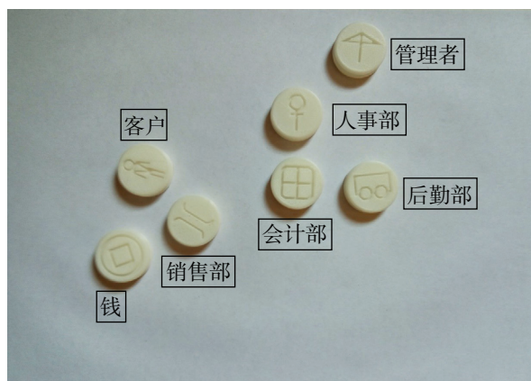
图 5 组织咨询应用实例 2

心理棋到了这里告一段落。后来咨询师通过董事长约谈了会计部经理，得知：“会计部是我女儿负责，但她不喜欢这份工作，她是学设计的”。通过访谈，找到了阻碍整个企业运作的问题：会计部阻碍了资金的运作，与客户的关系出现问题。问题找到了以后，董事长自然就有自己的安排：会计部换人，原负责人调到宣传部做设计工作。经过董事长进行了人事调整后，咨询师再次使用心理棋，通过同样的方法看看企业的改变（见图 5）。