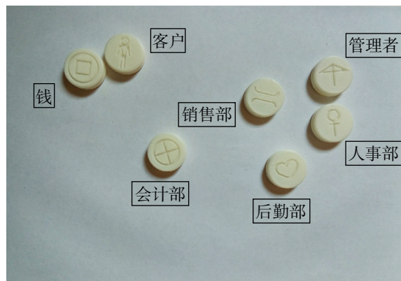
图 4 组织咨询应用实例 1

第一轮，由 7 个代表每人选出一个棋子放到棋盘上。然后咨询师作为主持人，询问每位代表的感觉。接着进入第二轮，7 个代表可以调整棋盘上棋子的位置，每位代表操作一个动作。然后每位代表继续谈感觉。如此循环往复，直到所有代表表示不愿意再变，棋局结束。最后结果如图 4 所示。