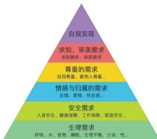
图1 需要层次理论金字塔模型

知需要和审美需要两个内容，而自我实现的需要依旧放在最高的位置 [31] （如图1所示）。