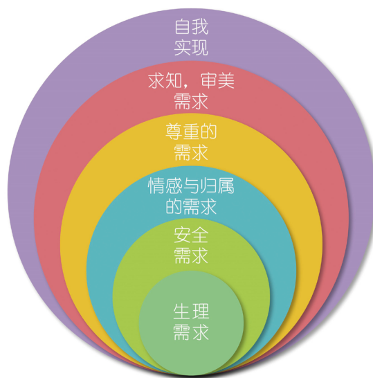
图3 需要层次理论新模型图例

那么需要层次理论有没有可能并不是一个由下而上的需要过程，而是一个由内而外的需要发展呢？在基础需要的部分则是与本身动物性的需要所不能分割的，但是这些基本需要却仅仅是动物性的需要，无法能够融入社会，而进一步发展的需要则是表现出更多社会化的部分，因此社会化的需要会存在于动物性需要的外围，并且社会化越深就会满足马斯洛所认为的更高级的需要。并且，从圆形象征来看，圆形的的设计更符合马斯洛需要层次理论的内涵表达，如每一种需要虽然被作为不同的高级与低级的分类，但是并不是严格的等级差异，而只是一种分类的方式，这与平等的象征符合；同时循环、完整的含义更有助于将不同的需要层次看作一个整体而不是割裂开来专注于某一种需要的特异性，对于人来说，每一种需要应该都存在于人，而不是单一的需要是否会缺失；并且同心圆的象征意义更是与马斯洛的以自我实现为目的相互契合。因此结合圆形象征意义以及生态系统理论的内容后，提出了新的需要层次理论模型（如图3所示）。