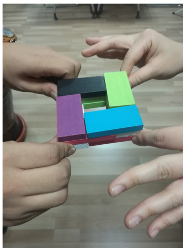
图 1 积木动力修复技术中抬的技术

通过交流，咨询师了解到来访者的生活是整日在店内卖货，用她的话来说是“生活乏味枯燥”，旧日的创伤重新被唤醒主要来自她对于目前婚姻的不满意，或者准确地说，来自她与老公的零情感交流。建立她与老公的彼此的沟通愿望才能重新激发婚姻激情的动力，治疗来访者旧日创伤。运用“抬”（动力修复技术中的一种技术，用于促使关系中的双方产生沟通的愿望。具体操作是关系中的两个人共同抬着三层基本型积木塔，如图 1 所示，走完规定路线，回到起点放在治疗桌上。如果没有两个人彼此沟通交流的介入，这个任务是完不成的）的技术加以实现上述心理咨询目标。