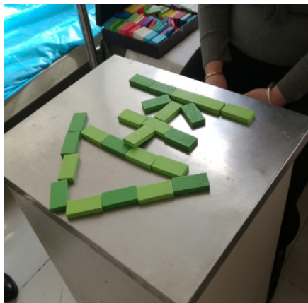
图 4 某 48 岁女性躁郁症恢复期患者垒建的积木塔

实践中发现，如果来访者垒建的积木塔存在上述四点及四点以上特征，那么应该属于异常心理（如图 4 所示）。