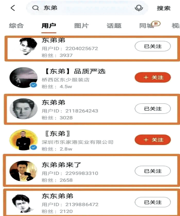
图1 3月19日在快手平台上搜索“东弟”的结果