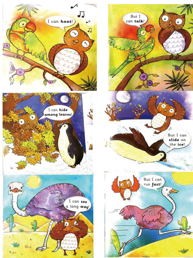
图5 分级绘本教学示例 Figure 5 Example of hierarchical picture book teaching