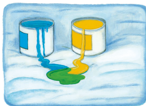
Blue and yellow make green.