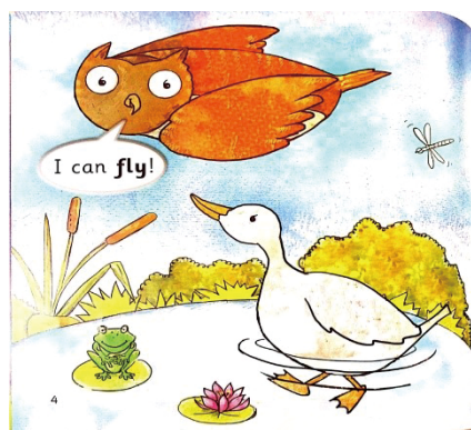
图3 我能够飞翔 Figure 3 I can fly