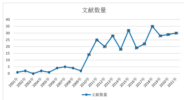
图 1 2001—2021 年我国红色体育研究文献数量的年度分布图

第一阶段为缓慢发展阶段(2001 年—2008 年),相关研究文献较少,该阶段论文数量为 19 篇,占总体文献数量的 5.92%。究其原因,该阶段人们对红色体育认识不够深刻,缺乏相应的理论支撑。第二阶段为快速发展阶段(2009—2011 年),我国红色体育研究年发文量增长趋势较为明显,三年间论文发表共计 41 篇,占总体文献数量的 12.77%。笔者认为这一变化与 2008 年北京奥运会的成功举办有关,红色体育开始逐渐受到学者们的关注。第三阶段为稳步发展阶段(2012—2021 年),红色体育相关研究的论文数量跌宕起伏,但发文量相比之前有大幅度提升,经统计论文数量为 261 篇,占总体文献数量的 81.31%。总之,其发文量变化具有极不稳定的变化趋势,发文数量虽然呈现上下波动、一年增多一年减少的状态,但是总体来说发文量随时间的变化推移呈现逐渐上升的趋势,说明最近几年来科研人员对于红