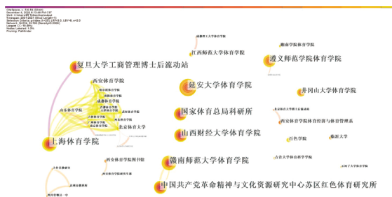
图3 2001—2021年我国红色体育研究机构合作网络

节点的大小表示机构发文数量的多少,节点与节点之间的连线反映机构之间合作强度的疏密 [6] 。通过 Cite Space 对研究机构合作关系发现(图3),国家体育总局科研所与赣南师范大学为代表的综合类体育院校构成该领域核心机构;以这些机构为节点附近还围绕着其他合作机构,例如,上海体育学院与以上海体育学院为首与附近围绕的西安体育学院、北京体育大学、成都体育学院、山东体育学院等机构合作群。