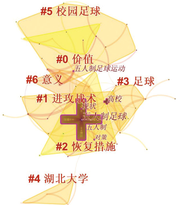
图2 关键词共线关系图

发展意义。与之完全重合的族群中,出现频次最高且最具有代表性的关键词是“校园足球”,校园足球的价值和发展也是这个部分的研究重点之一。“进攻战术”命名的知识族群中包括的关键词有:进攻战术、中后卫、室内五人制足球、世界杯等,可以看出这部分的研究是跟五人制足球的技战术研究,比赛研究等运动竞赛方面有关,同时通过与之大面积重合的族群的分析得知关键词包括了:恢复措施、运动损伤、5-0战术。可以看出该部分在研究五人制足球独特的技战术的同时,还对运动训练中的伤病和恢复进行了研究,这两个部分的研究目的都是服务于竞赛方面,认为这一部分的研究是以运动竞赛为热点研究。以“足球”命名的族群中关键词数量相对较多,其中主要的关键词有:足球、可行性、分析,该部分的研究是以五人制足球的可行性为主。通过阅读核心文献可以发现,该部分属于五人制足球的发展和意义。“意义”命名的知识族群与多个知识族群有着重叠关系,它的关键词包括了:意义、推广、战术、校园。与之前的校园足球,战术等研究几乎一致。唯一一个完全独立的族群包括的关键词有:湖北大学、校企合作、体育教学。可以直观地发现该部分属于高校的发展。从关键词出现频次及中心度来看,出现次数越多的关键词在知识图谱中对应的十字架大小也就越大,因此发现除了聚类中出现的具有代表性的关键词以外,“高校”“发展”“对策”“现状”等词出现频次也较多,且中心度也相对较高。