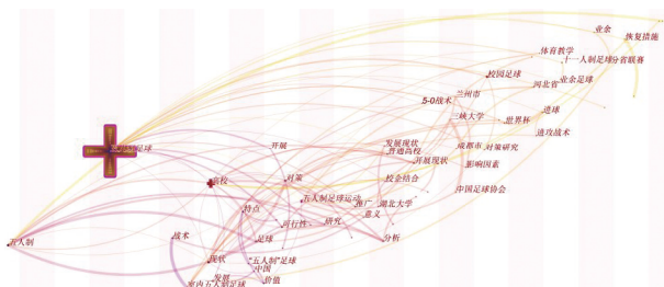
图3 关键词时间线图

时间线图(见图3)可以帮助我们直接看到关键词首次出现年份,直观地帮助我们了解五人制足球这个领域的发展过程。关键词虽然可以帮助我们看到研究热点,但是由于关键词数量众多,因此可以使用突现词帮助我们更好地找到研究热点。突现词是指软件检测突然出现频次变高的关键词,说明该时间段该关键词为研究的热点。因此突现词与时间线知识图谱相结合可以帮助我们更好地分析出该项目的发展过程。