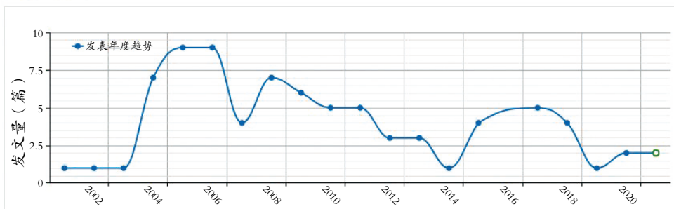
图1 2001—2020年CNKI收录的竞技体育后备人才CSSCI文献年度分布