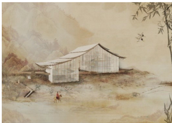
图3 不同的观景效果

为了使传统民居的特色得以放大,设计时将房屋的木框架结构和梁檐的部分暴露出来,再外挂玻璃幕墙,使得从外往里看可以清楚看到穿斗式结构木架,从里往外看自然风光,视线也不会被遮挡。为了观赏性能够达到最佳,每个单元建筑窗户都面对远山,不同角度都能拥有不同的观景效果。(如图3所示)