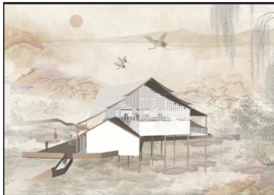
图 2 单体建筑效果