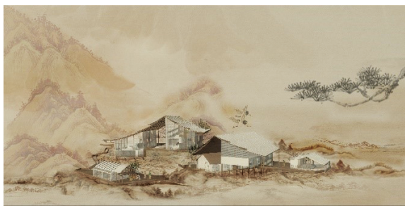
图 1 远景效果

关于室外设计理念，课题组在考察了解当地的自然环境下，希望民宿是一个沿山而落带状分布的多体建筑。民宿的整体外形还是当地民居常见的坡屋顶，因为依山而建，当地晨起黄昏都会有云雾环绕，觅·云巢这个名字就得缘于山间云雾的自然景观，在民宿外形上也希望与云雾这一元素呼应，在屋顶的设计上使用斜置面磨砂玻璃顶，多片叠加，形成云层的感觉。（如图 1、图 2 所示）