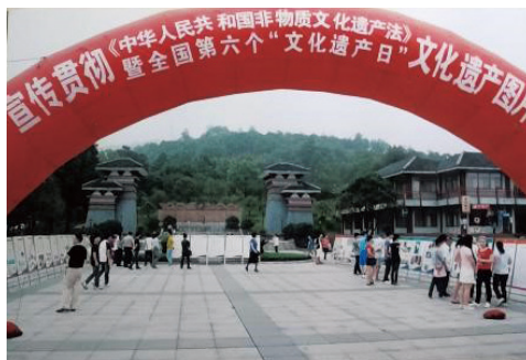
图1 咸宁市组织非遗保护工作

早年世界上许多国家对于本土民族传统文化逐渐有了保护传承的意识，并制定相关的法律和机制，取得比较成功的经验。例如丹麦等国家走访、记录、整理民间文学艺术并建立专门的部门去研究；北欧等国家开展文化生态保护、博物馆等；印度等国家设立专门场所去集中培养手工艺人，甚至还有国家专门设立“国家遗产日”活动，加强国民对非物质文化遗产的保护意识 [2] 。近年来，在党中央、国务院的高度重视下，各级文化部门积极努力和社会群众的参与下建立和完善，中国特色的非物质文化遗产保护制度。自2006年以来，咸宁市全面启动非遗保护工作，出台决议，加强相关的依法保护，宣传非遗、弘扬传统、创新发展等（如图1）。但对于后期线上数字化宣传相对薄弱，结合当下大众数字媒体的流行趋势，举例实际可操作模式。