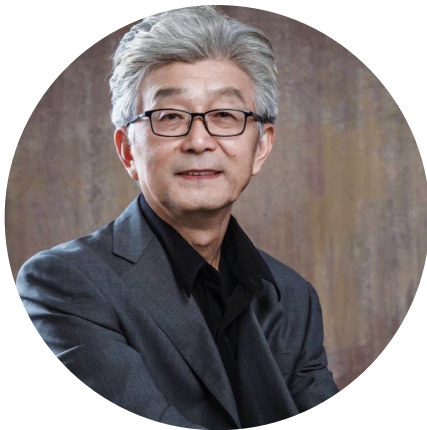
赵振宇近照 Zhao Zhenyu

2021 年 4 月 29 日，赵振宇在湖北广播电视台举行题为“怎样认识和做好新闻评论”的讲座。5 月 8 日，赵振宇在武汉体育学院举行题为“掌握意识形态领导权，做好新时代舆论工作”的专题讲座。5 月 24 日，赵振宇接受华中科技大学出版社的邀请，就《新时代，怎样认识和做好新闻评论？》进行首次网络直播。5 月 31 日，赵振宇华科大宣传部邀请作了《倡导时间文明，保障实现中国梦》的演讲报告。6 月 4 日，赵振宇以《做勇于担当，善于传播的新闻人》为题，