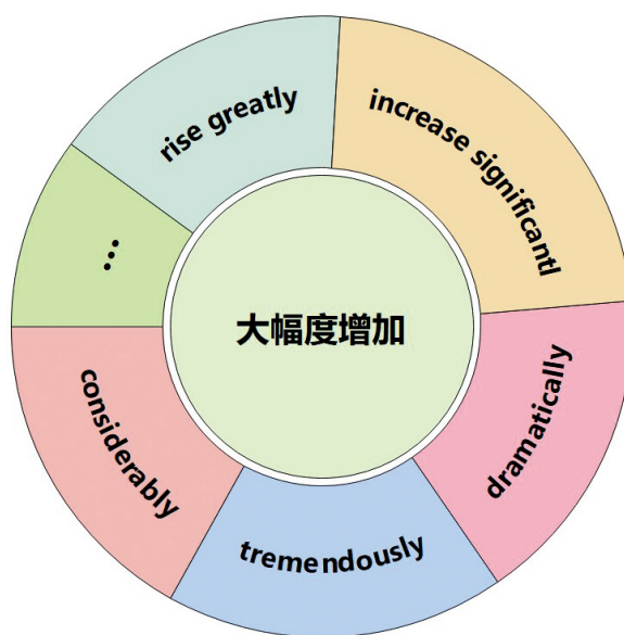
图1 “大幅度增加”英语表达同义词

在同义词升级上，教师指导学生以可视化的方式发散和总结与主题相关的同义词和短语，具体来说，学生通过一个核心词汇，继续展开相应同义词和近义词的扩展，在写作中的词汇选用上避免单一和重复，要体现词汇的深度，难度和广度。如“大幅度增加”，大部分学生不假思索地想到的是“rise greatly”，教师在教学过程中可以有意识引导学生通过发散思维在导图上写出更多同义词（如图1），“increase significantly/dramatically/tremendously/considerably”这些词更能增加文章的亮点，显而易见，词汇的丰富是构成一篇好文章的基础。