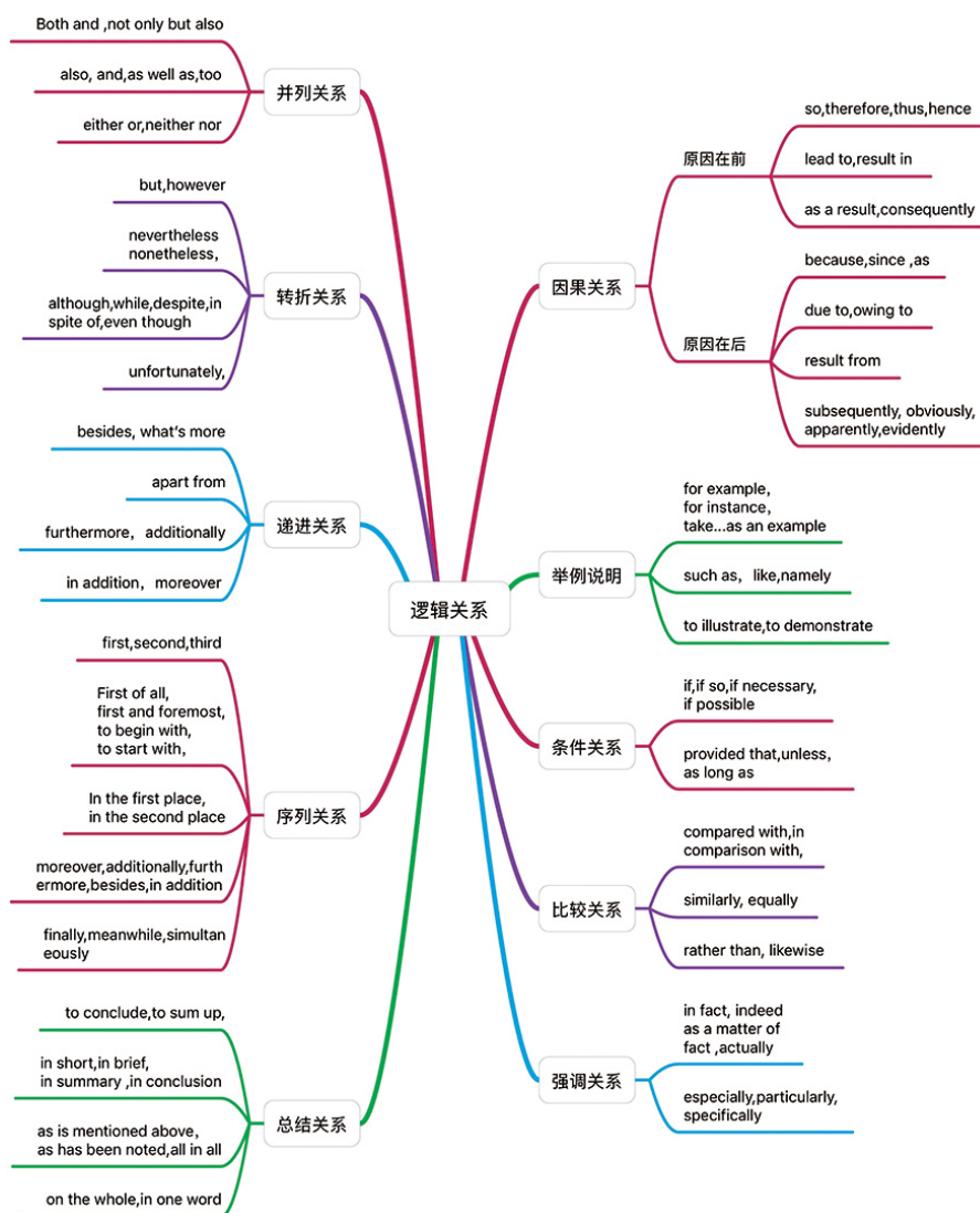
图 2 英语写作中常见的逻辑关系

在语言基础夯实的同时，也要加强学生的逻辑思维训练。学生在写作中，出现若干句式罗列，结构松散，连贯度不够，逻辑不通等问题。教师可以引导学生通过思维导图的形式，梳理总结写作中常见的逻辑关系（如图 2）。