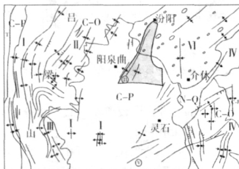
I. 黄河东北构造带; II. 祁吕弧形构造带东翼; III. 交口旋转构造; IV. 太岳山南北构造带; V. 晋中多字型构造; VI. 汾河晚近槽地