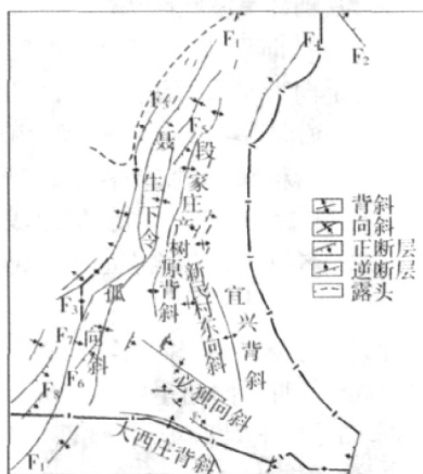
图2 研究区构造纲要图