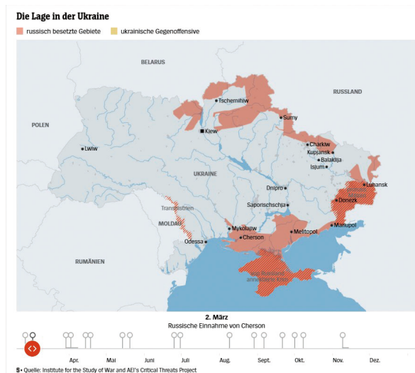
图1 3月2日俄罗斯占领赫尔松

在互联网、流媒体等数字媒体相关技术的发展推动下，视频作为新闻内容的媒介承载形式为用户提供了相较于文字、音频、图片更多的信息内容，视听的双重调动增强了新闻内容的感染力。明镜在线划分的“俄罗斯对乌克兰的战争—视频”中，大量视频新闻使新闻信息更具冲击力和说服力。此外，更多的信息技术被运用到可视化呈现中。如在展现乌克兰东部战争局势时，明镜在线以地区地图为基础，在上面标示了俄国军队进军方向、战争点，移动数轴上的滑块可以看到不同时间（日期）的战局情况。有效填补了对乌克兰东部缺乏了解的认知沟壑，较强的易接近性有着文本信息无可比拟的优势。