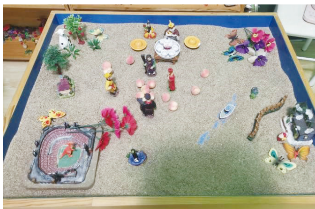
图 3 第三次团体箱庭