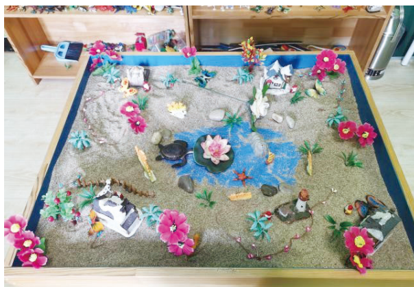
图 4 第四次团体箱庭

该阶段的两次作品都围绕 K 怀念死去小狗这一故事线展开。W 在狗的旁边摆放棺材，Y 在棺材上摆放花枝表达对死亡的尊重，但却引起 K 的不适，M 将棺材移走并埋起来，W 又将它移回原来的位置。在整个过程中虽然有不愉快的情绪出现，但经过讨论，成员都能够理解对方的行为，并在恰当地时候使用行动支持。共同主题《吞噬绿洲》表示成员懂得不能凭借外表判定事物的好坏，要注重理解事物的内在含义。个人主题也趋于一致，L、W、K 以《亲切》《友情》《思念》表达了对亲情和友情的珍视，《花下有花》《吞噬》《美丽与悲伤》揭示了一幅和谐作品下鲜为人知的故事、感情和内涵。总的来说，讨论过程中出现的分歧变少，成员之间有了共感理解。