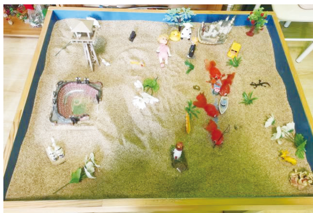
图2 第二次团体箱庭