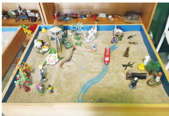
图1 第一次团体箱庭