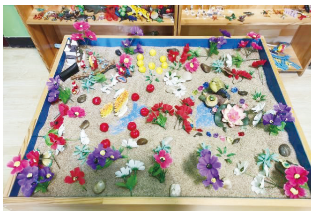
图5 第五次团体箱庭