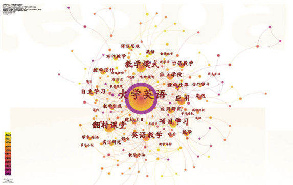
图 2 国内大学英语项目式学习研究关键词共现图谱