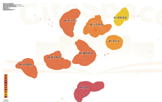
图 3 国内大学英语项目式学习研究关键词聚类图谱

Cite Space 软件通过 LSI 算法、LLR 算法、MI 三种算法提取聚类标签。标签数越小, 聚类中所含关键词越多, 规模越大。为了对近年来国内大学英语项目式学习研究的热点领域进行归纳, 通过 Cite space 软件的关键词聚类功能, 研究采用 LLR 算法, 得出关键词聚类图谱和关键词聚类表, 分别如图 3 和表 3 所示。图 3 中的关键词聚类的 Q 值为 0.6273, 大于 0.3, 且 S 值为 0.9399, 大于 0.5, 均符合图谱分析要求, 说明本次聚类效果较为显著。2012—2022 年间国内大学英语项目式学习研究其关键词可以聚为以下 8 类, 依序分别为大学英语、翻转课堂、教学模式、实践、自主学习、英语教学、项目式、课程思政。由此可见, 国内大学英语项目式学习的研究方向呈现多样化的趋势。