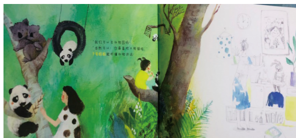
图 6 绘本《12个妈妈》其中一页

其次，这两本绘本在色彩选择上注重明确的区分，使场景的色彩呈现更加鲜明和清晰。在《12个妈妈》中，由于涉及两个妈妈形象，作者通过色彩的对比进一步加以区分。在图6中可以看到，当女孩与想象中的妈妈在动物园时，运用了绿色、黄色等明亮的颜色，突出了活跃的环境氛围和形象的生动感。明亮的颜色给人一种活泼、充满活力的感觉，与动物园这个场景相呼应。这种色彩选择为读者创造了愉悦的氛围，并提升了形象的吸引力和冲击力。同时，这种明亮的色彩也突出了女孩对妈妈的想象，使其形象更加生动而引人注目。与之相对比的是真实妈妈形象，采用了冷色调，主要是白色、灰色和蓝色，色度较低。这种色彩选择帮助突显了真实妈妈形象经常被忽视的特点。冷色调更接近现实生活中的中性色彩，缺乏鲜艳和明亮的特点，更加贴近真实妈妈的形象。这种色彩的运用降低了真实妈妈形象的视觉吸引力，强调了她平凡、朴实的特质。