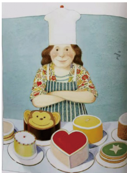
图 3 绘本 My Mom 其中一页