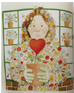
图 5 绘本 My Mom 其中一页