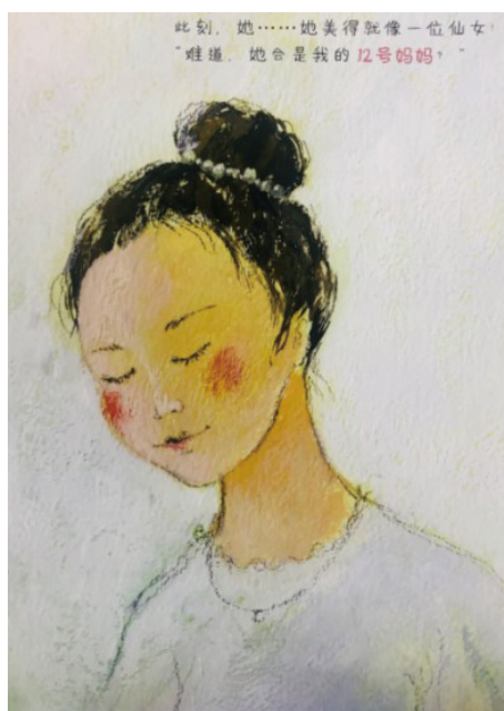
图 4 绘本《12 个妈妈》其中一页

而在《12 个妈妈》这本绘本中,针对想象中的妈妈形象采用了最简风格,如图 2 所示。此处妈妈的眼睛和嘴巴通常以简单的圆点或圆形来代表。由于面部特征没有细致地展现,这样的图像可能引发观众的情感体验相对较弱。然而,值得注意的是,《12 个妈妈》这本绘本也特别强调想象妈妈和真实妈妈之间的区别。当真实妈妈出现时,绘画风格更加偏向自然主义,使用了更具体的面部特征,如图 4 所示。