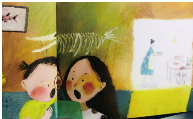
图 2 绘本《12 个妈妈》其中一页

经统计，《12 个妈妈》中有 9 个接触类图像，且其中没有直接接触图像。此绘本更多侧重故事本身的描述。绘本中孩子与妈妈没有与读者进行直接的眼神接触，这使得读者更多以旁观者身份阅读绘本，如图 2 所示。