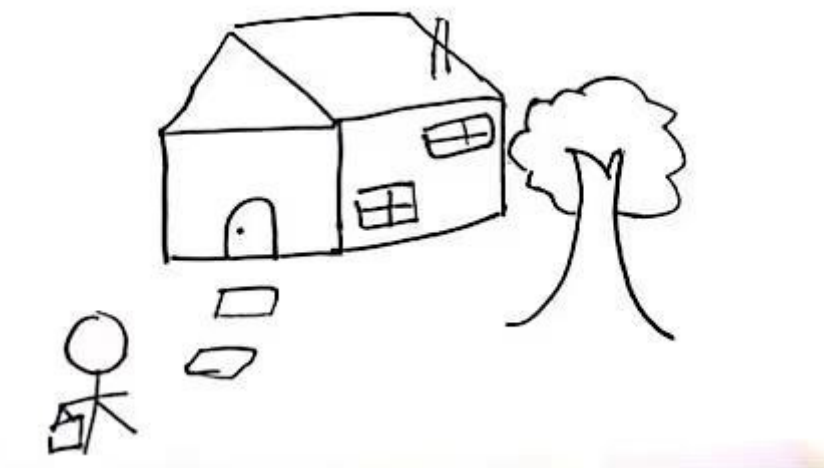
图1 来访者房树人绘画作品示例

如图1所示，来访者在“房树人”绘画测试中总体表现较好，无极端负面想法。从“树”的绘画特征来看，该树树干粗壮，无树枝交叉，无树根或地平线等，说明过往成长经历比较美满幸福。在与来访者沟通过程中，来访者也提到了自己的妈妈，认为妈妈在自己小时候因为某事对自己有愧疚感，所以能明显感受到妈妈的内疚和想要弥补的愿望。树冠较圆润，但是没有果实或花，说明来访者当下的目标感并不强烈。