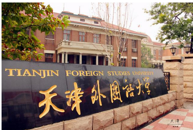
图2 天津外国语大学

运动员的教育引领作用,厚植爱国情怀、筑牢理想信念、激发昂扬斗志,帮助运动员树立正确的成绩观。(1)挖掘历史案例,彰显榜样力量。体育部以教师为主导,结合党史学习教育成果,深度挖掘体育运动、网球运动中的历史案例,常态化利用训练时间,教师以“小知识”“小案例”为抓手,运用宣传讲授、交流研讨、比较反思等方法,强化学生的爱国情怀与荣辱观,培养运动员的忠诚品质。(2)强化个人信仰,坚定理想信念。体育部教师充分运用“不忘初心、牢记使命”主题教育成果,结合思想政治专题课程,与思政教师展开深入的互动合作,进一步引导学生筑牢理想信念。体育部定期邀请思政教师走进网球训练课堂讲授思政理论,同时安排运动员向思政教师传授网球技能,在互动中学思践悟,帮助运动员提升以理论武装头脑的自觉性。(3)践行初心使命,促进网球运动发展。体育部以网球项目为核心,以日常专业训练、各类比赛为平台,让学生充分感受成为网球项目运动员的自豪感以及为学校、为国家争得荣誉的使命感。