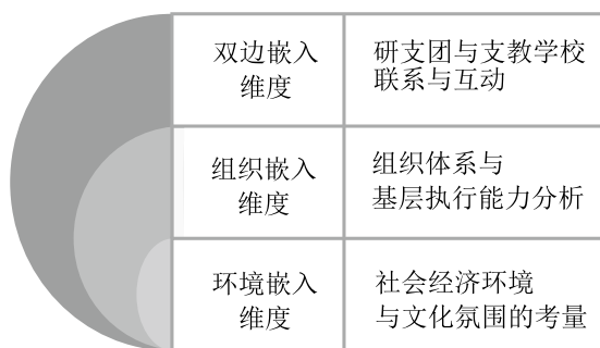
图1 嵌入理论研究框架图

嵌入理论与本研究具有高度适配性，研支团作为一种组织小团体融入到当地教师队伍中，与当地的镇政府、各级团委、其他社会性及自治组织相互补充，共同推进农村教育发展，经济、社会变革。同时在现代化的发展进程中研支团服务西部带去技术迭代更新，为当地的社会经济发展提供了充分条件。研支团成员深入当地，直接接触当地社会环境，更能轻易接触、敏锐发现当地社会环境中所存在的诸多问题。双边嵌入、组织嵌入和环境嵌入是相互关联的，它们共同构成了一个完整的嵌入网络。