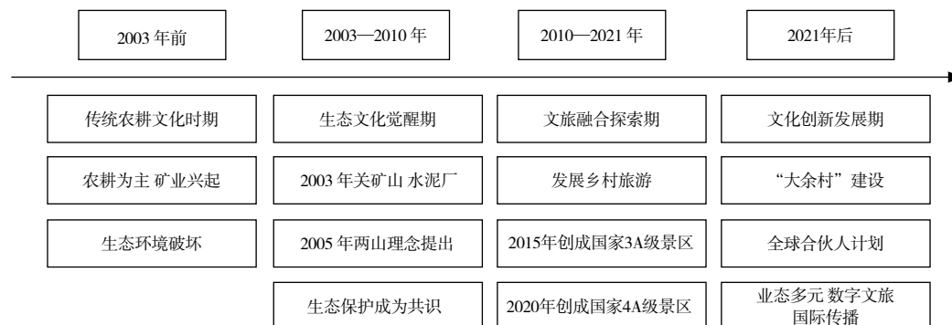
图 1 余村文化发展时间轴

余村的文化创新发展呈现出明显的阶段性特征，经历了从被动适应到主动创造的演进过程，根据历史资料将其分为如下四个阶段。