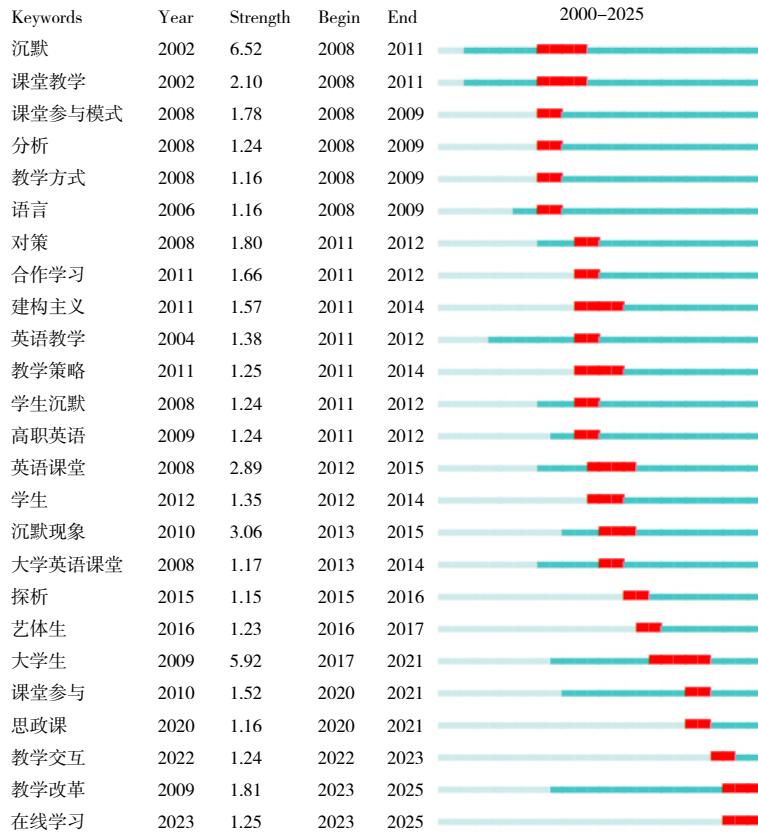
图 6 关键词突现图谱

度 [31] 。与此同时，教育技术的快速更新迭代，以及大规模在线教育实验，推动教学互动形态产生新变化。崔思佳等基于在线教学交互模型，将大学生在线课堂沉默分为行为沉默、思维沉默、行为和思维的双重沉默三种类型，并指出应构建学生、教师、学校和社会行动共同体 [32] 。研究者聚焦于在线课堂沉默，分析教学交互模式的变化，探索教学改革路径，以期缓解课堂沉默 [33, 34] 。对不同学科、不同教学形式下的课堂沉默展开研究，推动教学改革，以提高学生的课堂参与度，已成为近年的研究热点和前沿方向。