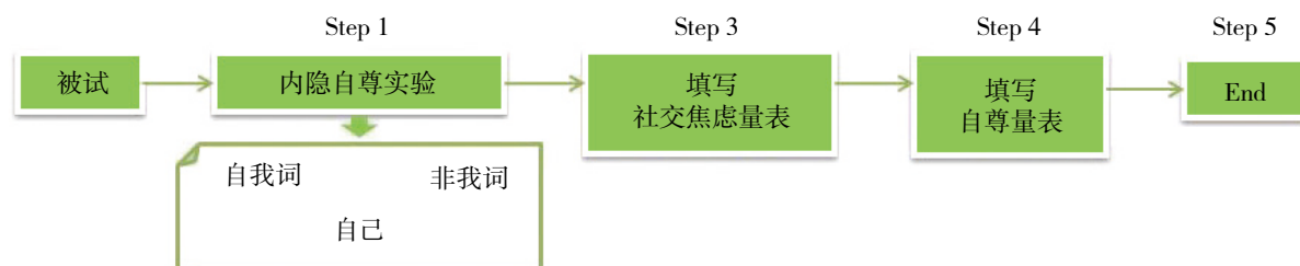
图1 实验的操作流程及内隐联想测验的实验示例

做分类反应的提示词（如图1，比如“自我词”“积极词”“自我词或积极词”这三类），要求被试看到刺激词尽快做出反应，如果刺激词属于左侧属性，被试就要按下“Q”键；如果刺激词属于右侧属性，被试就要按“P”键，反应有正确和错误之分；刺激词会逐个呈现给被试，记录被试的反应时和正确反应，最后填写交往焦虑量表和自尊量表。