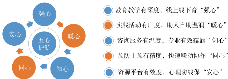
图1 “五心”护航强心理育人体系

我校大学生心理健康教育工作纳入学校的整体规划和思政工作体系，努力做“全”规章制度，做“好”教育教学，做“足”宣传教育，做“广”实践活动，做“专”咨询服务，做“准”危机预防与干预，从而构建了我校“五心护航强心理 立德树人育匠心”的心理育人工作体系（如图1所示），开创了我校学生心理健康教育工作的新格局。