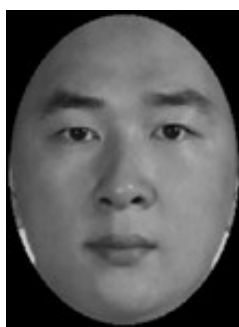
图1 批评者面孔图片