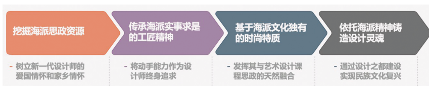
图2 海派文化与艺术设计课程思政融合路径及流程

在中国设计领域的发展历程中，长期以来存在跟风西方流行趋势的现象。而蕴含文化特色的产品才是具有生命温度、感人的产品。上海作为中国的时尚之都，以建设设计之都为目标，以丰富而独具特色的海派文化为基础，身处其中的设计人才尤其应从挖掘和复兴海派文化开始着手。