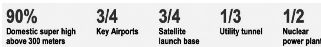
图1 中国建筑集团有限公司在英文网站上的企业简介

超文本翻译中常包含丰富的可视化元素，如图表、图片、视频等。这些元素可以帮助读者更好地理解 and 记忆翻译内容，提高翻译的可读性和吸引力。例如中国建筑集团有限公司在其中文网站的企业简介中这样写道“中国建筑投资建设了90%的超过300米的摩天大楼、3/4重点机场、3/4卫星发射基地、1/3城市综合管廊、1/2核电站”。如图1所示，在其英文网站中，译者将这句话包含的信息用放大字体，改变颜色的方式呈现出来，并放在文本中，帮助读者捕捉重要信息 [7] 。