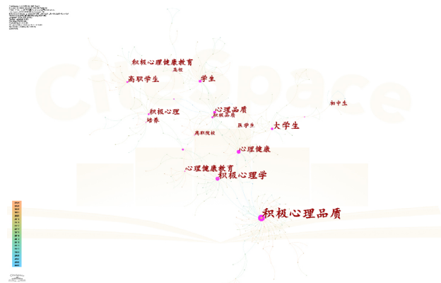
图 4 学生积极心理品质研究关键词共现图谱

重要内容。结合表1中频次大于等于2且中心性大于0的关键词统计结果可知,研究主题是积极心理品质,研究对象是学生,早期以研究中小學生为主,从积极心理学的视角对中小學生心理品质、综合素质的培养对策进行深入研究。大学生、高职学生、中职学生随后也成了主要研究对象,调查研究院校的德育、培养策略对学生的影响以及学生本身所具备的社会支持系统、贫困留守经历。2020年以来探究方向逐渐转向高校学生干部的心理健康水平现状,进一步推动心理育人的进程。