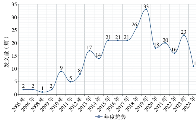
图 1 年发文量变化趋势图

对近 20 年（2005—2024 年）关于“积极心理品质”+“学生”研究的年发文量进行统计分析，结果如图 1 所示。