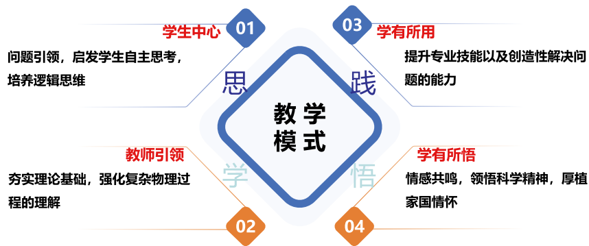
图2 “思—学—践—悟”教学模式示意图