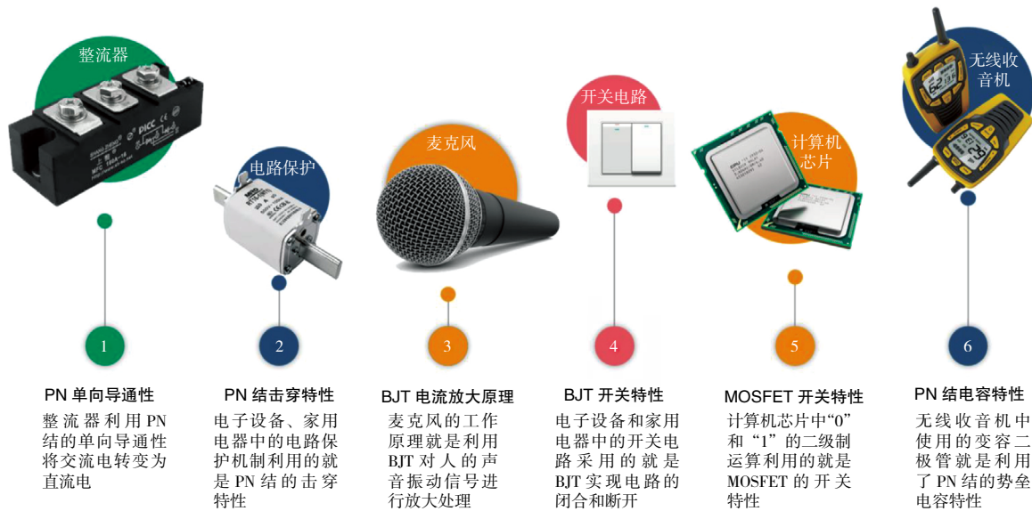
图3 工程案例库示意图

何种变化；（3）电场对载流子的运动产生何种影响；（4）漂移运动和扩散运动谁更有优势。这些问题将半导体掺杂特性、载流子浓度梯度等核心概念有机地串联起来，建立新知和旧知的内在关联，学生在循序渐进的思考中攻克难点障碍，实现知识的渐进式迁移。基于以上思路，课程建立工程案例库（如图3所示），将理论知识与应用案例建立一一对应的关系，开展高效的启发式教学。