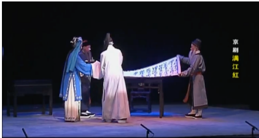
图4 京剧《满江红》的置景和重要道具

舞台的重心不在景，在演员的表演上，如图4、图5所示。当今随着社会发展，也有部分戏曲舞台会以LED屏幕做舞美设计，减少实景部分。这与电影置景大有不同，电影置景讲究真实感，要求去戏剧化，因此大多电影在置景上会要求以更生活化的形式重现情节场景。