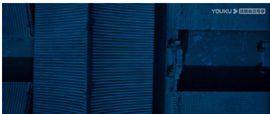
图 10 俯拍秦桧大院

情感。《满江红》中最令观众印象深刻的为众人在古宅大院的走廊前往线索地的戏份，其原因是此段戏份虽为过场戏，但结合了影像原本要表达的“走马灯”形式，在配乐上选取了“摇滚戏曲”，且本段戏份多次重复，以此在电影的整体叙事框架上做划分。因此在本段的拍摄手法中，为了契合“摇滚戏曲”的节奏，镜头设计上以运动镜头为主，配曲的节奏虽稍高，但镜头拍摄却遵循长镜头的拍摄风格，拉长镜头的拍摄时间，做镜头内部调度。这里镜头的展现为上帝视角的俯拍移动式长镜头，让这幅秦桧大院的画卷慢慢展开，如图10所示。类似镜头还出现在每个线索段落的开头，提醒观众以静观俯瞰事件发展。此外，上述提及的演员表演和场景设置舞台化、叙事方式的变化等都是强化电影《满江红》的“静观”手法，带领观众在景和情中完成从静观到想象的情感体验。