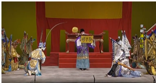
图5 京剧《满江红》的置景和重要道具

电影《满江红》依旧以实景拍摄为主，但在景的部分做了假定性舞台的场景设计，实现电影场景与戏曲场景的交融。《满江红》的故事内容主要发生在秦桧大院，所选择的拍摄场景面积较小，且为封闭性场景，有似于《小城之春》中的封闭颓城。导演张艺谋在采访中提到，专门盖了两个大院，二者都为山西大院复制，想要以此展现中国独有的建筑文化，让电影更具民族特征。“两个院的规格不太一样，然后把横向打通，还做了一些活片，可以拆掉，把它们打通，横向竖向的空间全有。其中有很多迷宫式的走廊，我很喜欢那种长长的走廊，把大院做成迷宫式的。中国