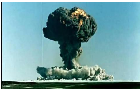
图3 1964年我国第一颗原子弹爆炸

革命军械武器装备涉及多方面的物理知识，例如最常见的武器——枪，“子弹出膛射击敌人”，涉及能量的转换、平抛运动、碰撞等物理知识；飞机在革命战争中的运用，利用飞机投送物资、轰炸等场景，涉及自由落体、力的合成、参考系等知识；在革命期间自主研发的卫星、火箭、导弹（如图3和图4所示），涉及万有引力、曲线运动、反冲现象、核裂变等知识；在革命时期通过无线电通信传播作战信息，涉及信息的传递、电磁波等知识。通过具体背景结合教学，积极鼓励学生主动参与和思考，充分发挥学生的主体性，资源的价值才能得到发挥和体现，从而落实革命传统教育。