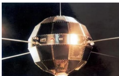
图4 中国第一颗人造卫星