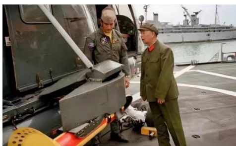
图1 刘华清将军参观美国航母

第二，优化育人观念。有利于教师转变传统的教学观念，践行以人为本的理念，并将教育重心由传统的知识本位上升到价值本位 [3] 。有利于转变学生的学习观念，能够从国家民族的层次理解学习的深远意义，进而明确自身肩负的责任和使命，还使得课程思政的落实有了具体的实施路径。以人教版初中八年级下册第十章浮力为例，其章节语中提到中国第一艘航空母舰“辽宁舰”于2012年9月25日正式使用，而在1980年我国在这一方面还是空白，当时刘华清将军踮脚参观美国小鹰号航母（如图1所示）。教师通过对比过去的落后与当下的进步，让学生了解到国人不畏艰难、自强不息的精神，培养学生知耻而后勇、知不足而后进的精神品质，让学生了解我国目前拥有的三大航空母舰（如图2所示），激发学生的爱国之情。